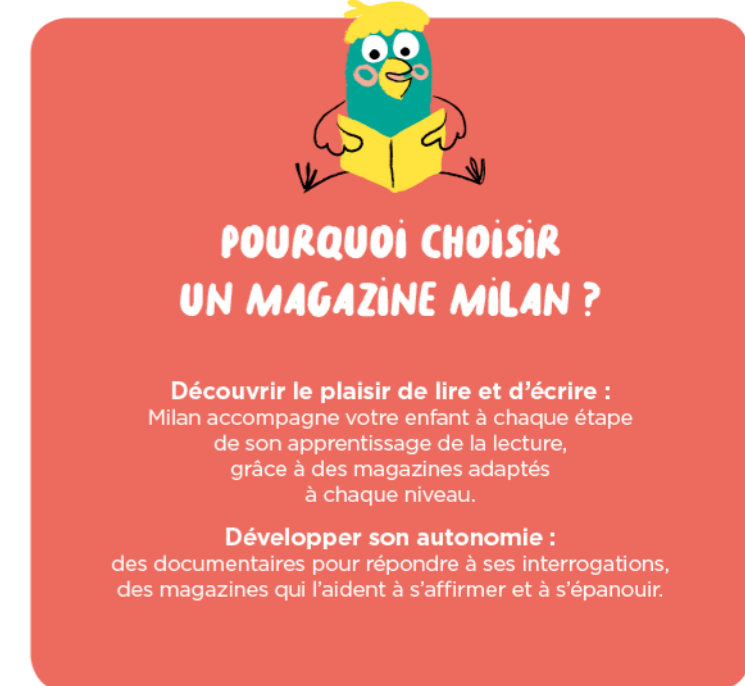
Illustration : Mylène Rigaudie